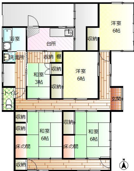
間取り図が実際と異なる場合は、現況を優先します。